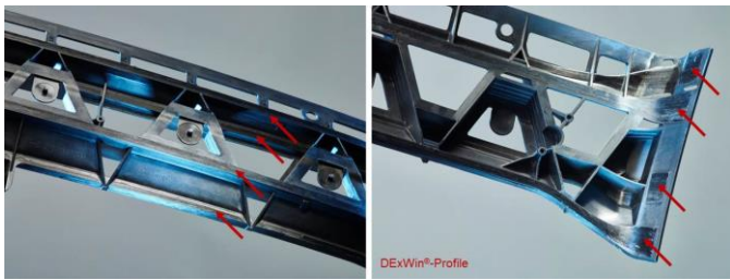
Abbildung 2: Endlosfaserverstärkte DExWin® Thermoplast-Profile der ProfileComp GmbH entlang der Bauteillastpfade (rote Pfeile)