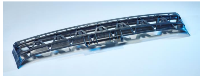
Abbildung 1: Composite-Hybrid aus carbonfaserverstärktem PA6

Bei der Bauteilkonzipierung wurden alle drei klassischen Leichtbaupotentiale – Material-, Struktur- und Systemleichtbau – ausgeschöpft. Das Ergebnis ist ein Composite-Hybrid aus carbonfaserverstärktem Thermoplast in Skelettbauweise (siehe Abbildung 1).